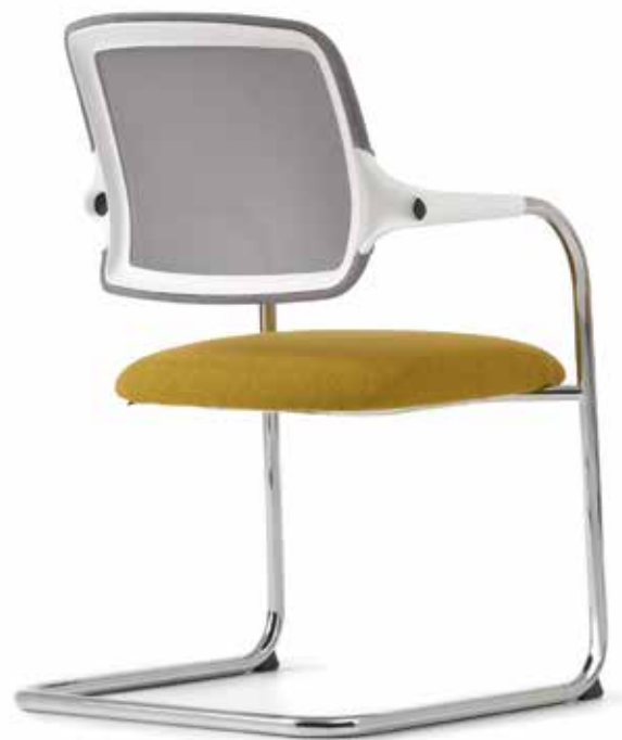
KO 5843 mesh Armauflagen | Armpads AA01KGS