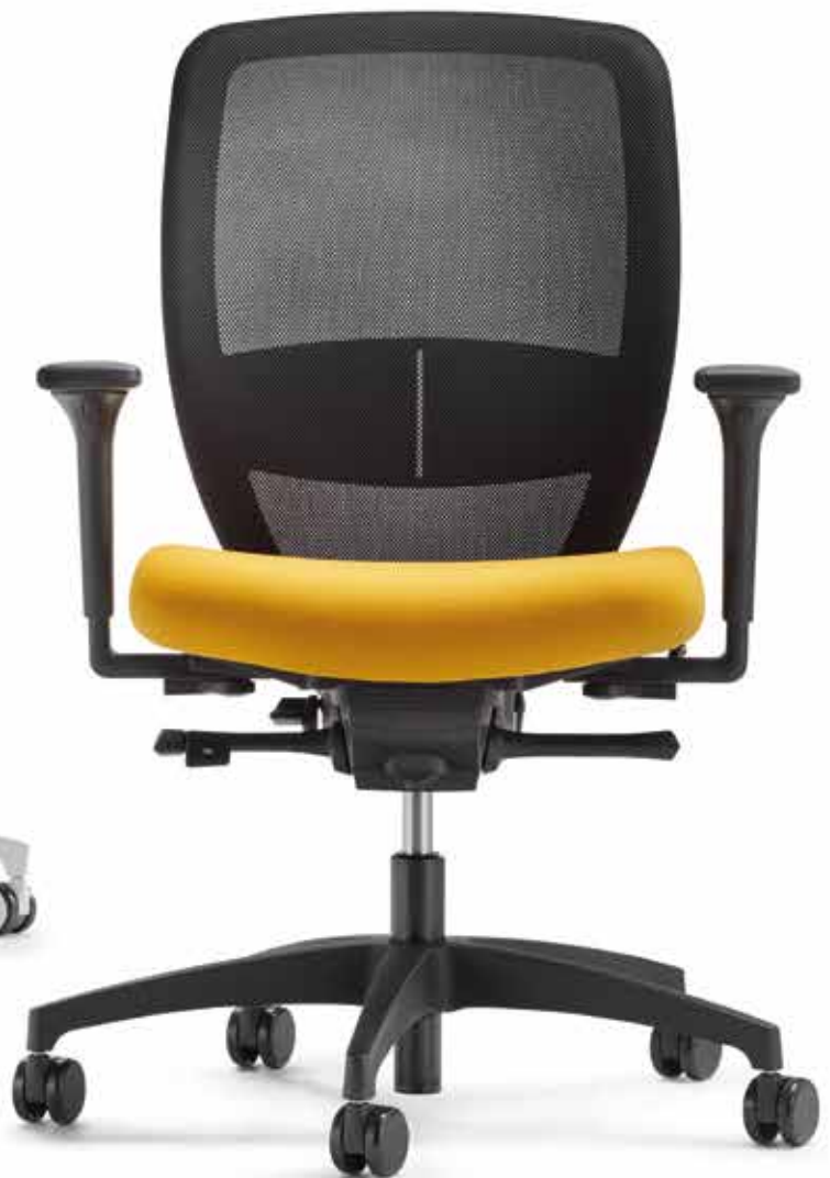
QS KO 5845 mesh + Armlehnen | Armrests A341KGS