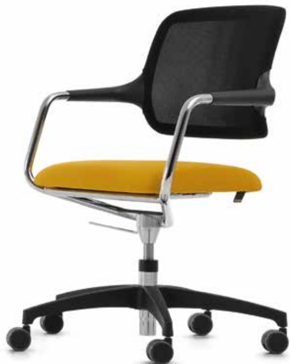
KO 5847 mesh Armauflagen | Armpads AA01KGS