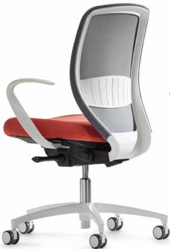
QS KO 5845 mesh + Armlehnen | Armrests A106KWW

The organic shape of the chair is elegantly reflected in the armrests. As a result, Kick-off radiates a pleasant homeliness which is often missing in today's offices. Syncro-Quickshift® is a particularly user-friendly mechanism which is ideal for shared workstations.