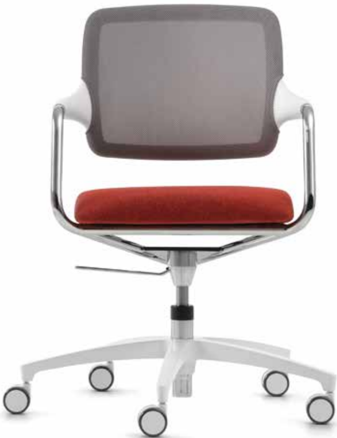
KO 5847 mesh Armauflagen | Armpads AA01KVV

The flowing lines of the Kick-off cantilever chairs and conference swivel chairs make them a perfect match for the swivel chairs. Both versions are equipped with armrests. The cantilever chair is available either in a non-stackable or a stackable version, which can be stacked up to 3-high, ensuring that space is used in a flexible manner. The conference swivel chairs can be adjusted in seat height and are optionally available with castors or glides.