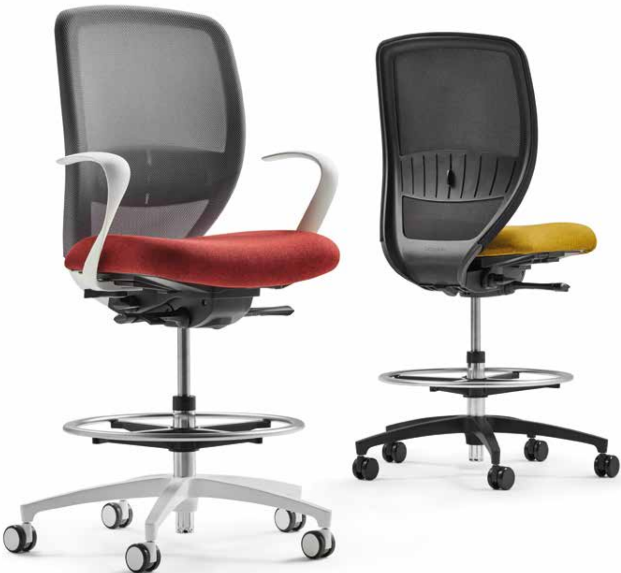
QS KO 5845_CFR mesh + Armlehnen | Armrests A106KVW

Kick-off as a counter swivel chair is the ideal seating solution for standing and short-time workstations. Load-dependent locking castors make it ultimately flexible and prevent accidental movements at the same time. Alternatively, gliders ensure optimal stability. The height of the non-slip chrome foot ring can easily be adjusted.