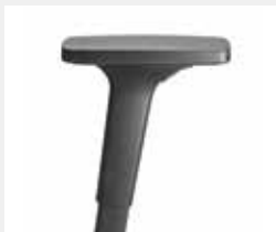
A240KGS (2F) Armauflagen PU Armpads PU