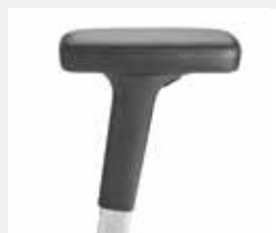
A442APO (4F) Leder-Armauflagen Leather armpads