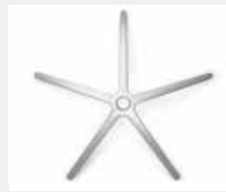
FHAVO Aluminium poliert (Option) Aluminium polished (option)