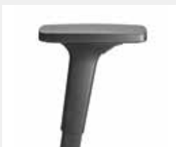
A240KGS (2F) Armauflagen PU Armpads PU