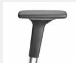
A541APO (5F) Armauflagen PU soft Armpads PU soft