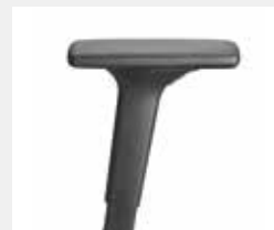
A441KGS (4F) Armauflagen PU soft Armpads PU soft