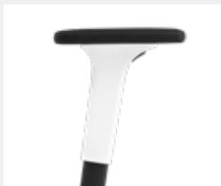
A241KGS* (2F) Armauflagen PU soft Armpads PU soft