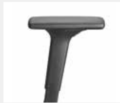
A441KGS (4F) Armauflagen PU soft Armpads PU soft