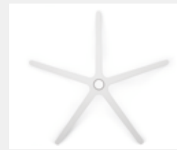
FHKVW Kunststoff weiß (Option) White plastic (option)