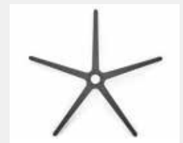
FHKGS Kunststoff schwarz (Standard) Black plastic (standard)