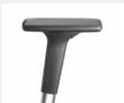
A341APO / A441APO (3F/4F) Armauflagen PU soft Armpads PU soft