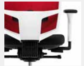
KVV Verkehrsweiß (~ RAL 9016) Traffic white (~ RAL 9016)

* Farbe der Armlehnenhülse = Modellfarbe Colour of armrest cover = model colour