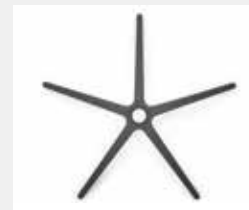
FHKGS Kunststoff schwarz (Standard) Black plastic (standard)