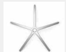
FHAGO Aluminium poliert (Option) Aluminium polished (option)