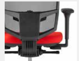
KGS Schwarz (RAL 9011) Black (RAL 9011)