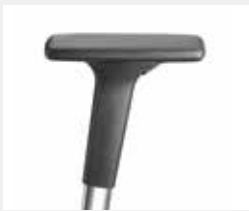
A441APO* (4F) Armauflagen PU soft Armpads PU soft