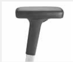
A442APO* (4F) Leder-Armauflagen Leather armpads